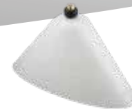
Capot de protection ovale, blanc No.d'art. 10501606