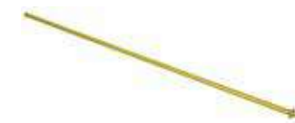
Lance télescopique en aluminium 1-2 m No.d'art. 10985201