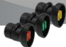
Buse à jet plat (XR 8001 VS – XR 8008 VS) No.d'art. 11612801-SB – 11612808-SB