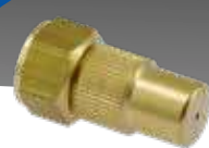
Buses réglables 1.3 mm et 1.7 mm No.d'art. 28502598-SB, No.d'art. 28502597-SB