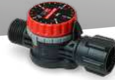
Valve régulatrice de pression ajustable PR 3 P1 No.d'art. 12140001