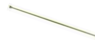
Rallonge 1 m droite, laiton No.d'art. 10960601